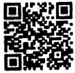
QR ๑. ประกาศ

สถานศึกษารางวัลพระราชทานประจำปีการศึกษา พ.ศ. ๒๕๕๔, พ.ศ. ๒๕๕๘ และ พ.ศ. ๒๕๖๒