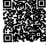
QR ๒. แบบตอบรับ